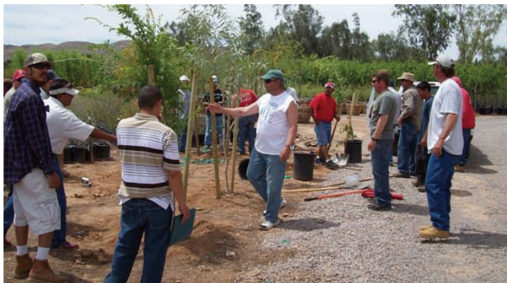
Tree Planting Training 5/2/09

Identificar Plantas - Phx 8/8/09 Y Tuc 8/22/09